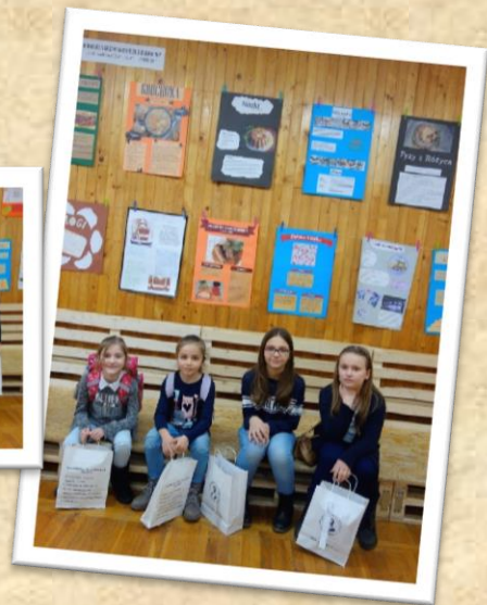
Nagrody, bardzo się spodobały !